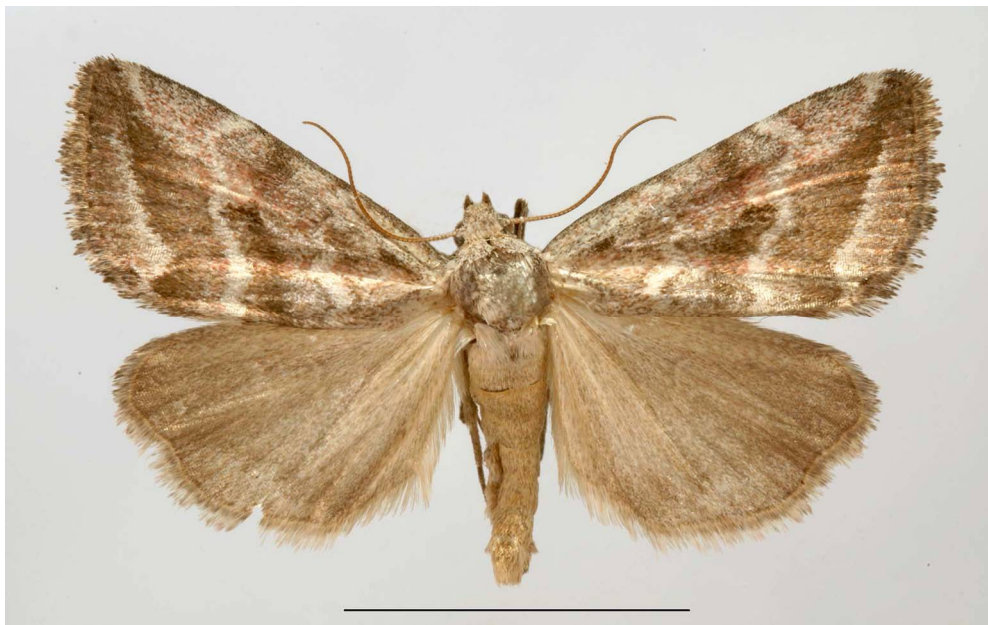
Fig. 7. Phyllophila obliterata (Rambur, 1833): ♀, Cala Maestra, m 30, 31.V/2.VI.2016.