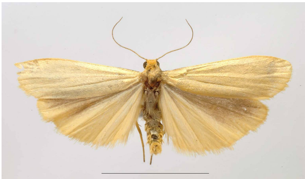
Fig. 6. Eilema pygmaeola (Doubleday, 1847): ♂, Cala Maestra, m 30, 31.V/2.VI.2016. (Foto: S. Bambi).

Cala Maestra, m 30, 31.V-2.VI.2016: 1 ♂; Valle di Cala Maestra, presso la sorgente, m 50, 1-2.VI.2016: 1 ♂. Specie già citata come nuova per l'isola da DAPPORTO & FORBICIONI (2014), ma senza dati di raccolta.