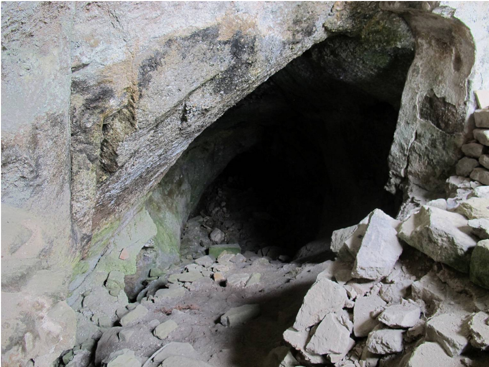
Fig. 10. Grotta del Santo, m. 225. Habitat di Hypena obsitalis (Hübner, [1813]).