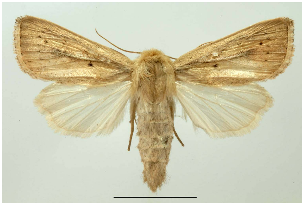
Fig. 8. Sesamia nonagrioides (Lefèbvre, 1827): ♀, Cala Maestra, m 30, 31.V/2.VI.2016. (Foto: S. Bambi).

Valle di Cala Maestra, presso la sorgente, m 50, 1-2.VI.2016: 1 ♂. Specie a larghissima diffusione già nota per tutte le isole dell'arcipelago (DAPPORTO & FORBICIONI, 2014). Dapporto ( in litteris ) mi comunica di averla osservata a Montecristo nel 2013 (dato non pubblicato). Primo reperto per l'isola.