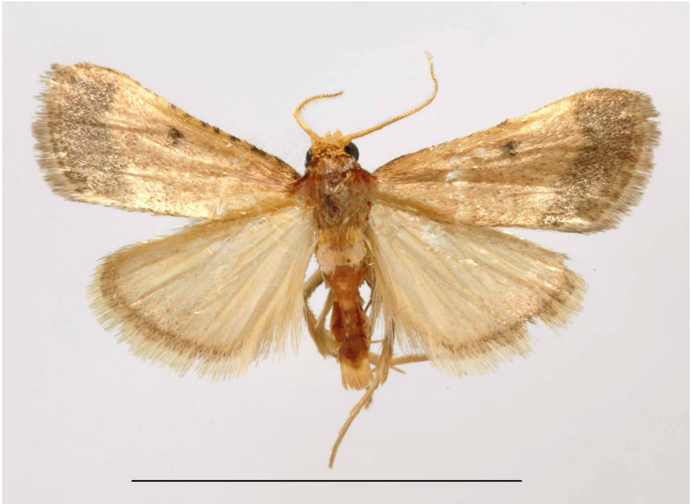
Fig. 1. Scotomerodes fuscolimbalis (Ragonot, 1887): ♂, Cala Maestra, m 30, 31.V/2.VI.2016. (Foto: S. Bambi).