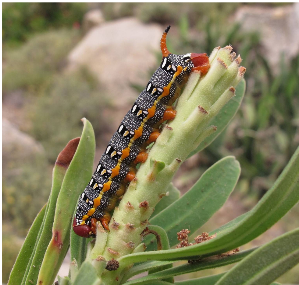
Fig. 3. Hyles dahlia (Geyer, 1827): larva L3 su Euphorbia characias , Spiaggia di Cala Maestra, 3.VI.2016.