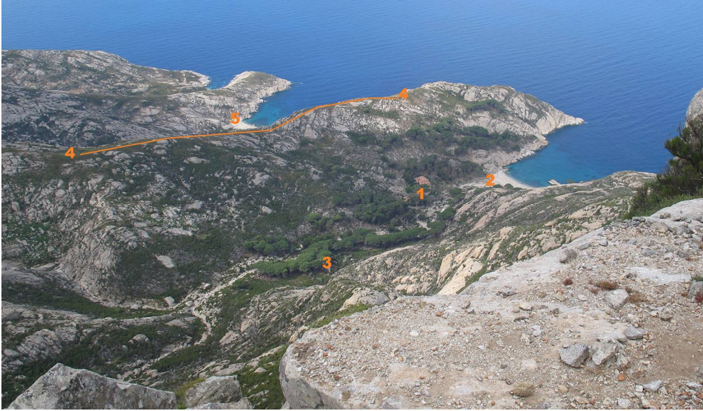
Fig. 9. L'area delle ricerche vista dal Monte della Fortezza (m 645): 1. Cala Maestra, m 30; 2. Spiaggia di Cala Maestra; 3. Valle di Cala Maestra, presso la sorgente, m 50; 4. Crinale del Belvedere, m 150/200; 5. Cala Santa Maria. (Foto: F. Cianferoni, modificata).