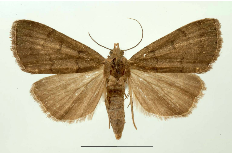
Fig. 5. Nodaria nodosalis (Herrich-Schäffer, [1851]): ♀, Cala Maestra, m 30, 31.V/2.VI.2016.