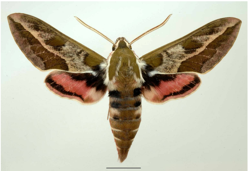
Fig. 2. Hyles dahlia (Geyer, 1827): ♂, 5.VIII.2016 ex larva, Spiaggia di Cala Maestra, 3.VI.2016. (Foto: S. Bambi).