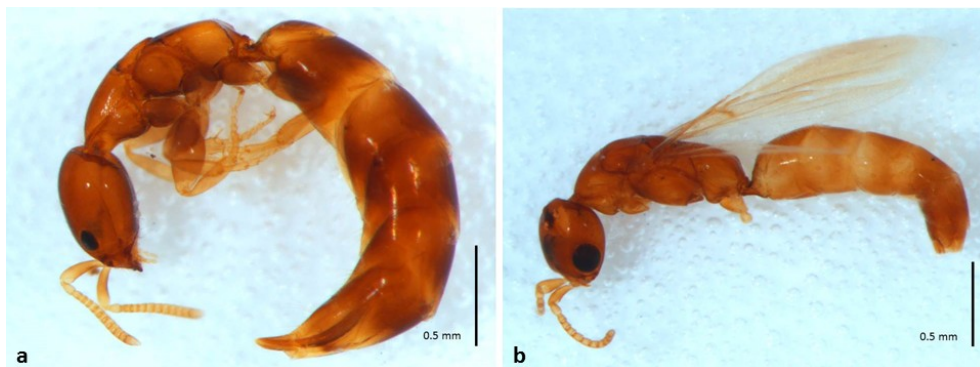
Fig. 1. Femmina (a) e maschio (b) di Sclerodermus domesticus .

Scopo del presente lavoro, data la limitata disponibilità di materiale bibliografico su questa specie, è stato quello di approfondire le conoscenze su questo micro-imenottero, in particolare in Toscana.