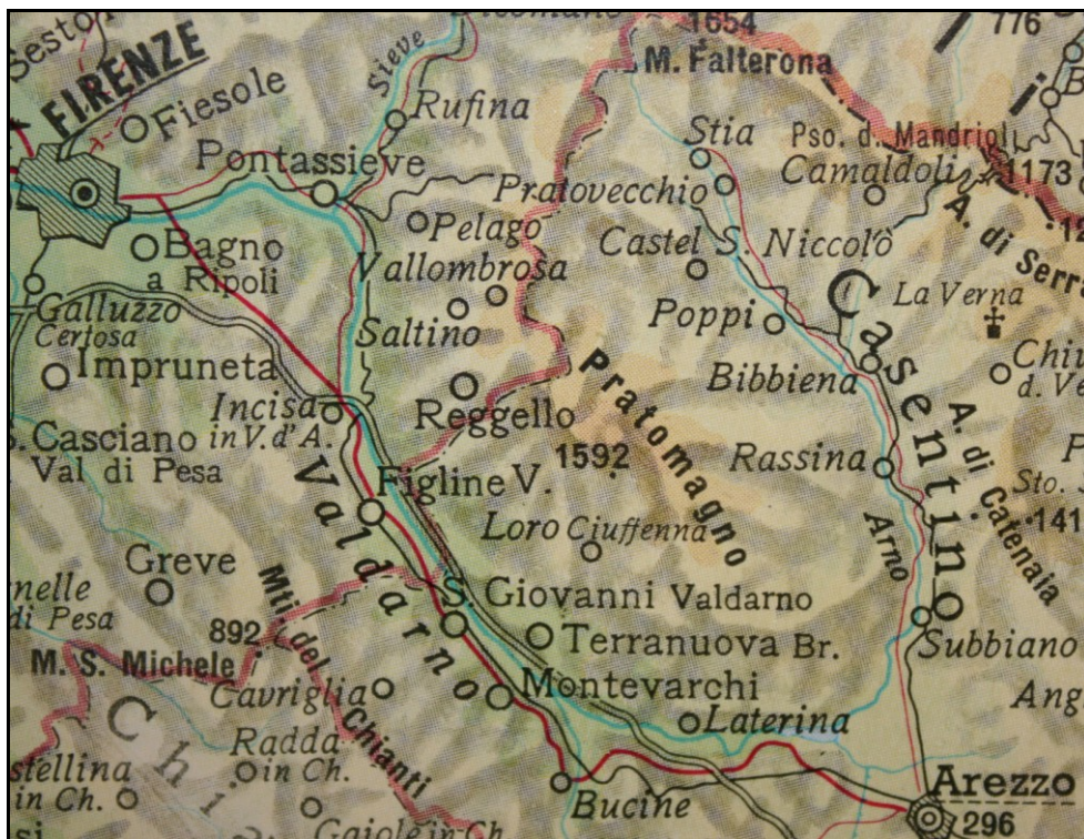
Fig. 1. Cartina rappresentante il massiccio del Pratomagno. L'area di indagine del presente lavoro è la semiellisse formata dal corso dell'Arno. Il valore di 1592 si riferisce ai metri di quota raggiunti dalla Croce di Pratomagno, la vetta più alta di tutto il massiccio.

Con questo contributo viene fornita una panoramica il più completa possibile sulle attuali conoscenze corologiche dei Cerambycoidea del Pratomagno, riportando numerose nuove località e molte specie che non vi erano mai state segnalate.